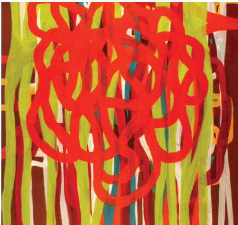
Tulio de Sagastizábal, Nada ocurre dos veces N° 6, 2003 (fragmento)