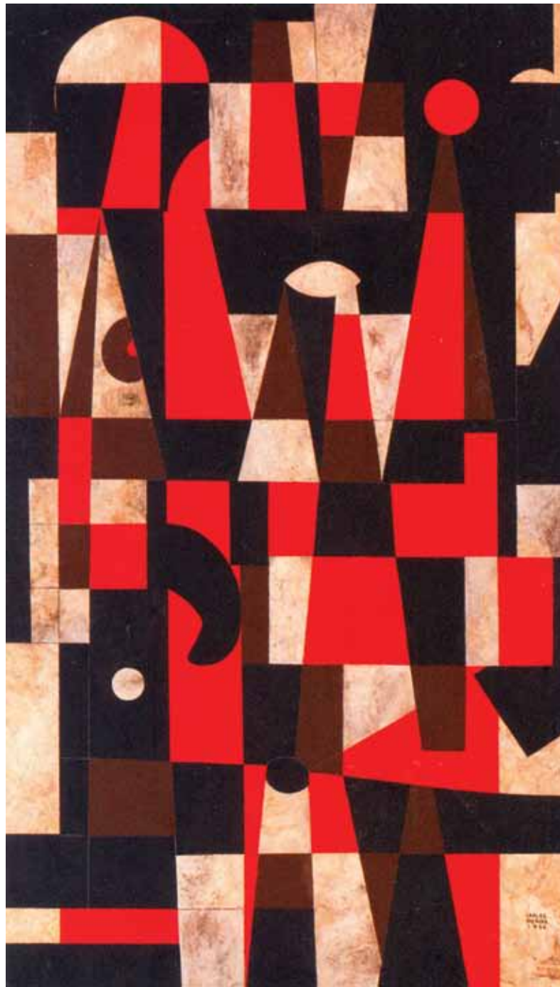
Carlos Mérida, sin título, 1966

En el razonamiento de la igualdad de oportunidades, las relaciones económicas de explotación, exclusión o pobreza se diluyen en el lenguaje de la competición. El modelo escolar que exalta la igualdad