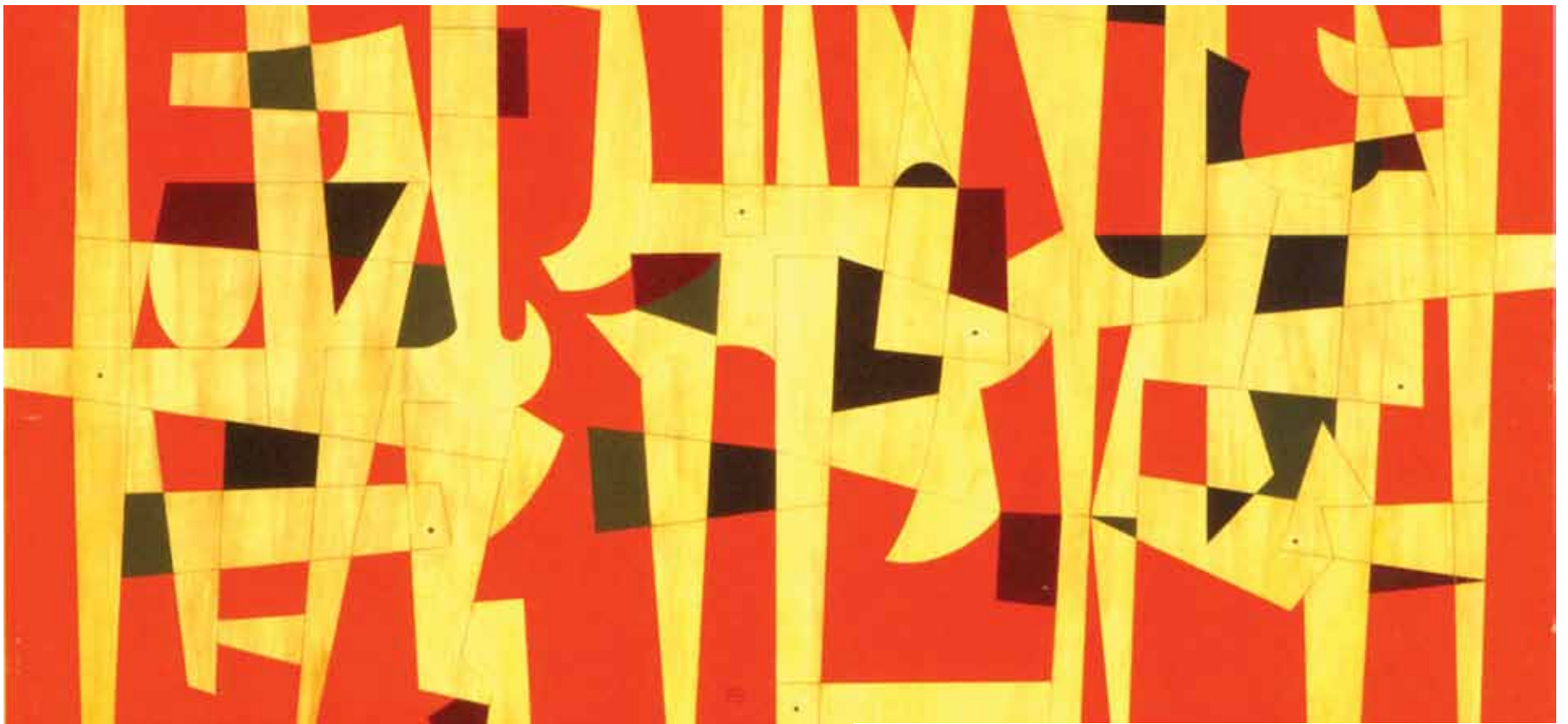
Carlos Mérida, El Éxodo de las Siete Tribus , 1961

→ se en la construcción de proyectos institucionales sólidos en lo académico y con fuertes vínculos personales.